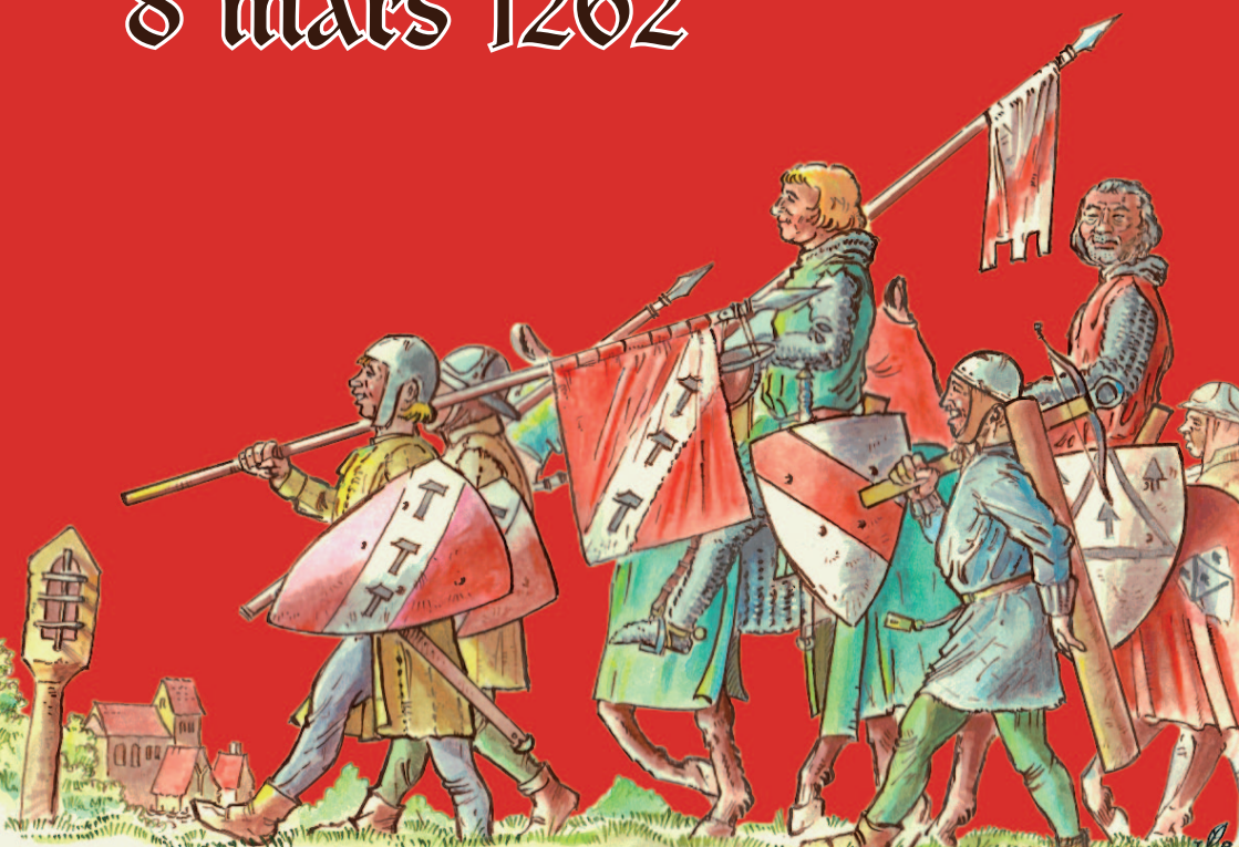
Illustration : Pierre JACOB

Du 7 au 11 mars 2012, 750 e anniversaire de Strasbourg, Ville libre